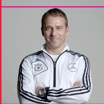
DFB-Sportdirektor Hansi Flick

„Kinder wollen frei miteinander spielen, ohne Anweisungen von außen.“